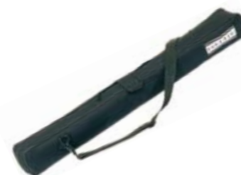
Bolsa de transporte