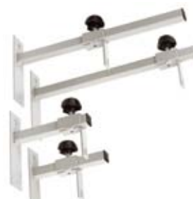
Separadores de pared PPLA0023/25