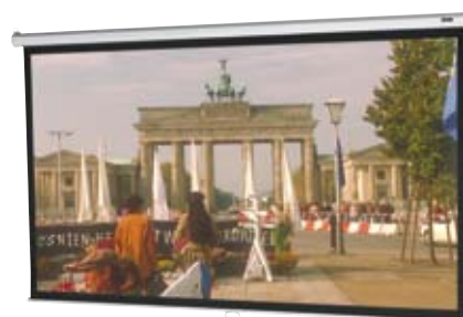
Pantalla manual formato 16:9